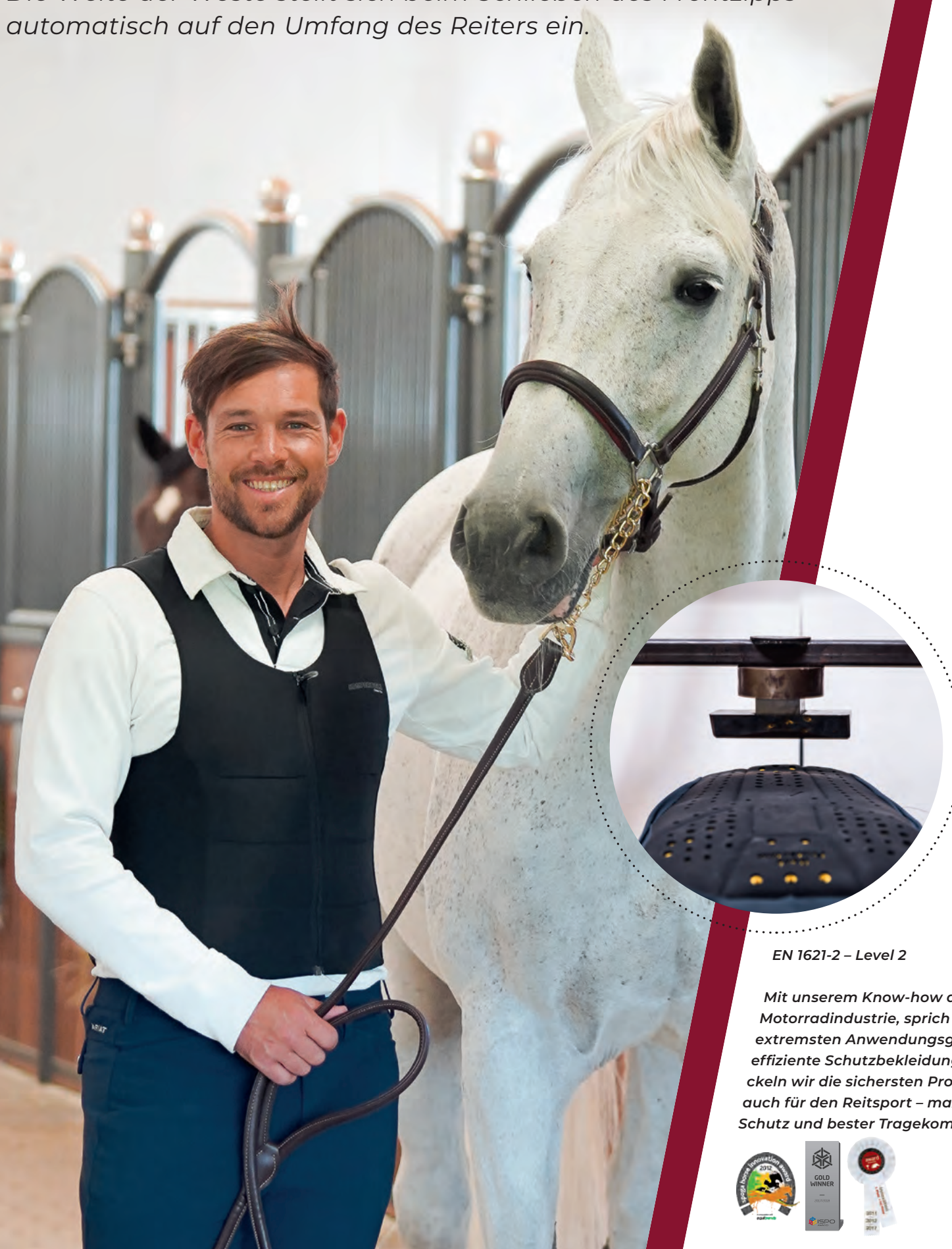
EN 1621-2 – Level 2

Kein Protektor trägt sich so leicht und angenehm. Die Weste bietet dem Reiter einen nahezu lückenlosen Rundumschutz. Die neue Generation unserer Ballistic Westen ist deutlich weitenflexibler. Die Weite der Weste stellt sich beim Schließen des Frontzipps automatisch auf den Umfang des Reiters ein.