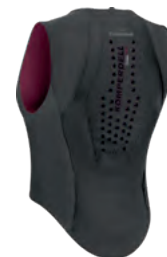
black / bordeaux