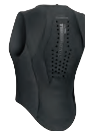
black / silver